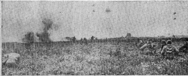
Soldados estadounidenses avanzan bajo el fuego de la artillería nazi en la región que rodea a la ciudad alemana de Ubach. La ofensiva dentro del territorio alemán continuó a pesar, de la creciente resistencia.