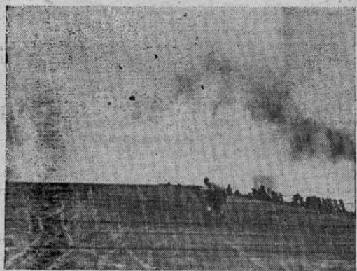
Columnas de espuma eleva a los cielos una bomba arrojada por un avión japonés que casi alcanza a un portaaviones de la Marina norteamericana durante un ataque en el Pacífico. El barco no sufrió ningún daño.