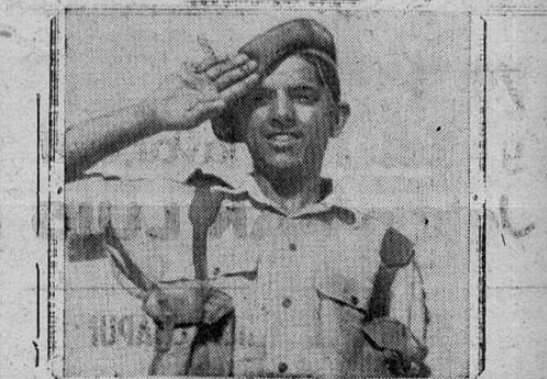
20-year-old Sepoy Kamal Ram, V. C., 8th Punjab regiment, who is the first Sepoy to be awarded the V. C., he is also the first member of the Indian Army to receive a V. C. in the Italian theatre.

The Germans are said to be ceding territory in the sector beyond Aquisgran, in the vicinity of the River Roer. They are also reported to be using their best reserves to replace the 100,000 casualties they suffered in killed, wounded and prisoners during the first three weeks of the Allied offensive along a frontage of 464 kilometers, running from Holland to the frontier of Switzerland.