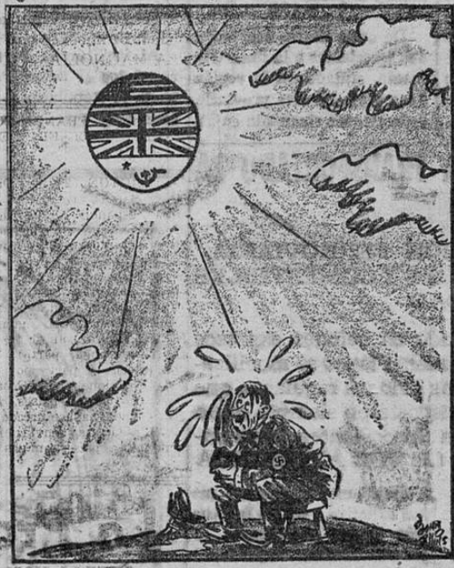
“Montreal Gazette” EMPIEZA A SER UNA INSOLACION

Nos permitimos llamar su atención a la nota al dorso de su recibo que dice: